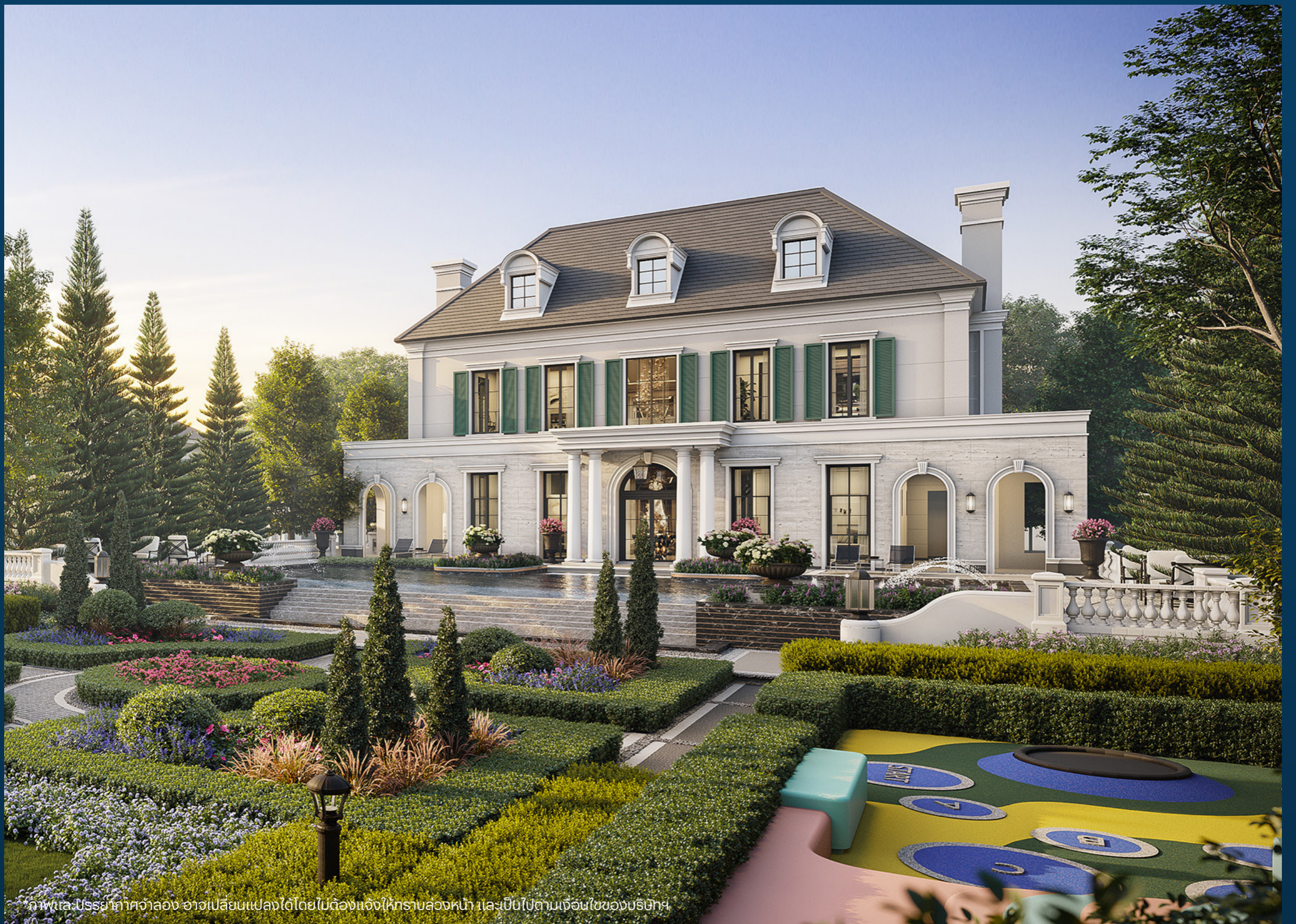
ภาพและบรรยากาศจำลอง อาจเปลี่ยนแปลงได้โดยไม่ต้องแจ้งให้ทราบล่วงหน้า และเป็นไปตามเงื่อนไขของบริษัทฯ